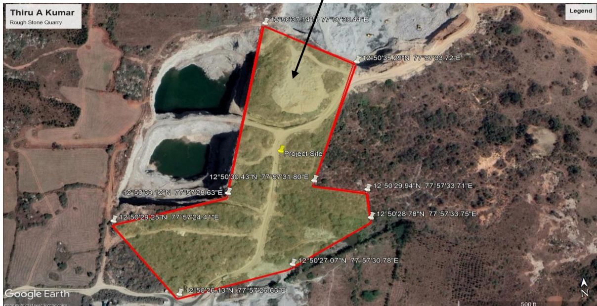
படம் :1 வரைபடம்