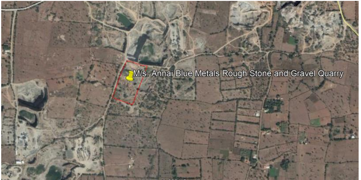
படம் :2 முன்மொழியப்பட்ட சுரங்க திட்டத்தின் கூகிள் வரைபடம்